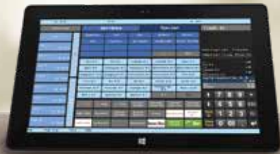
DURATEC POS PC