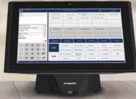
DURATEC POS S14

Immer eine gute Wahl: professionelle, stationäre Kassen von Duratec. Alle Modelle sind flexibel, intuitiv zu bedienen und das zu einem äußerst fairen Preis.